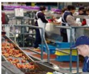
傷付きを防ぐため水に浮かせて作業中

丁寧に手摘で収穫されたチェリーは、すぐに工場へ運ばれます。そこで専門のスタッフにより慎重に選定、梱包され、お客さまのもとに届けられるのです。