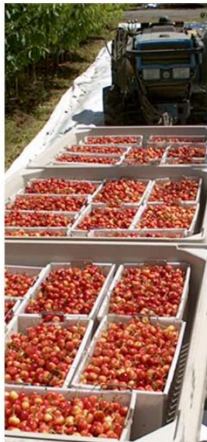
手摘みされたチェリーは慎重に運ばれます

丁寧に手摘で収穫されたチェリーは、すぐに工場へ運ばれます。そこで専門のスタッフにより慎重に選定、梱包され、お客さまのもとに届けられるのです。