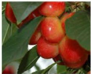
太陽をたっぷり浴びて大きく成長します

レーニアチェリーは、アメリカワシントン州原産のさくらんぼで、日本でよくみかける赤深色の”アメリカンチェリー”とは違い、薄紅色をしており、甘みがより濃厚でジューシーな大粒のチェリーです。山形の佐藤錦のような甘みがあり美味しいということで”アメリカの佐藤錦”とも呼ばれています。また、収穫時期が6月と7月のわずか1ヶ月しかないことから、市場に出回る機会の少ない希少価値の高い品種で”フルーツのダイヤモンド”と呼ばれるゆえんがそこにあります。