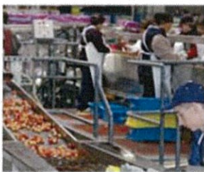
为了防止刮伤果实而正在进行水中筛选作业

精心手工摘下的车厘子被马上运往工厂。在工厂由专业的员工仔细挑选、包装，然后送到客户的手中。