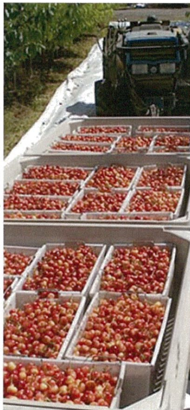
小心翼翼地运送手工摘下的车厘子

精心手工摘下的车厘子被马上运往工厂。在工厂由专业的员工仔细挑选、包装，然后送到客户的手中。