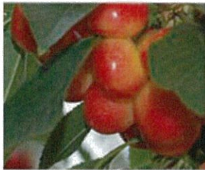
沐浴着充足的阳光茁壮成长

雷尼尔车厘子是原产于美国华盛顿州的樱桃，与日本常见的深红色“美国车厘子”不同，呈淡红色，甘甜浓郁且多汁，果实硕大。因其如山形佐藤锦般甘甜可口，所以被誉为“美国佐藤锦”。而且，收获时节仅为6月到7月短短一个月时间，是市面上少见的稀有高价品种，也因此被称为“水果钻石”。